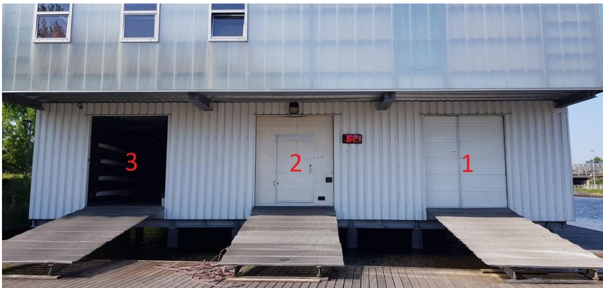
Loods met gangpaden 1, 2 en 3.

Bij binnenkomst op Gyas is het verplicht om je handen te desinfecteren. Vanaf de ingang tot aan de loods is de looproute aangegeven op de vloer. Daarnaast wordt ook de 1,5 meter aangegeven op de vloer met strepen. Alle ruimtes op Gyas zijn gesloten, behalve de toiletten, de loods en de ruimtes die gebruikt worden om toegang te bieden tot de loods. Vanwege aanwezigheid van het bestuur zal de bestuurskamer ook open zijn en alleen toegankelijk voor leden van het bestuur. Toegang naar de loods zal gaan via de deur in de gang of via de kleedkamer; de kleedkamer is hier enkel open om als looproute naar de loods te fungeren. Gangpad 1 en 2 in de loods bereik je via de looproute die door de kleedkamer gaat. Gangpad 3 in de loods bereik je via de looproute die door de deur in de gang gaat.